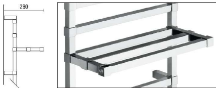
Mensola / Shelf / Полка

Watt= Kcal/h ÷ 0,860 Kcal/h= Watt x 0,860