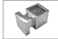
Appendiaccappatoio / Bathrobe hanger / Халат вешалки

Lunghezza cavo per articoli presa 1200mm Cable length for wire provided models 1200mm Длина провода для электрических моделей - 1200 мм.